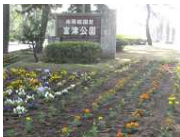
マリーゴールドなどに 植えかえました！