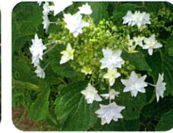
アジサイ 墨田の花火