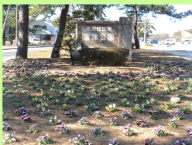
公園入り口の花壇