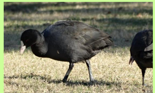
オオバン (ツル目・クイナ科)