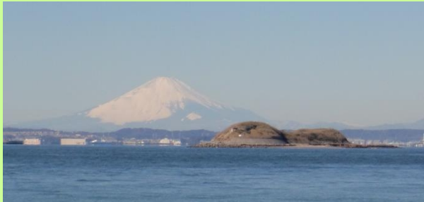
富津岬から富士山と第一海堡が望めます