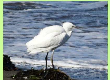
コサギ (コウノトリ目・サギ科) くちばしは黒く、目元は黄色です