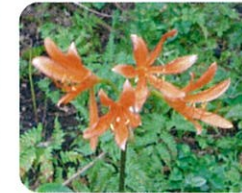
キツネノカミソリ