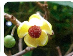
ピナンカズラ 雄花