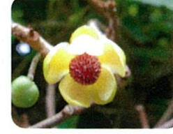
ビナンカズラ 雄花