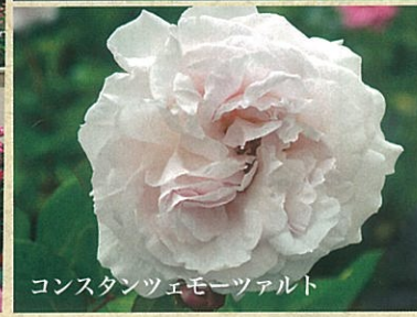
コンスタンツェモーツァルト