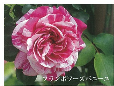
フランボワーズパニーユ