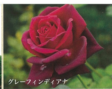
グレイフィンディアナ