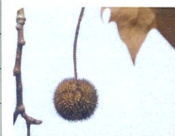
モジバズ 加片実エ-3