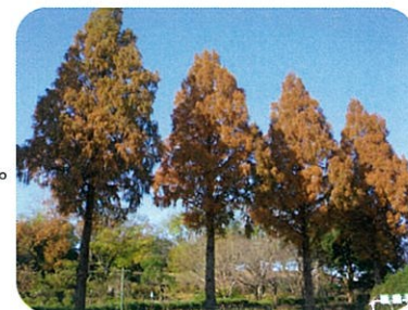
メタセコイアの並木

秋から冬にうつりゆく季節。植物園では紅葉・黄葉の他、色々な木の実の観察ができます。落葉した冬の木の姿は樹形観察が楽しめます。