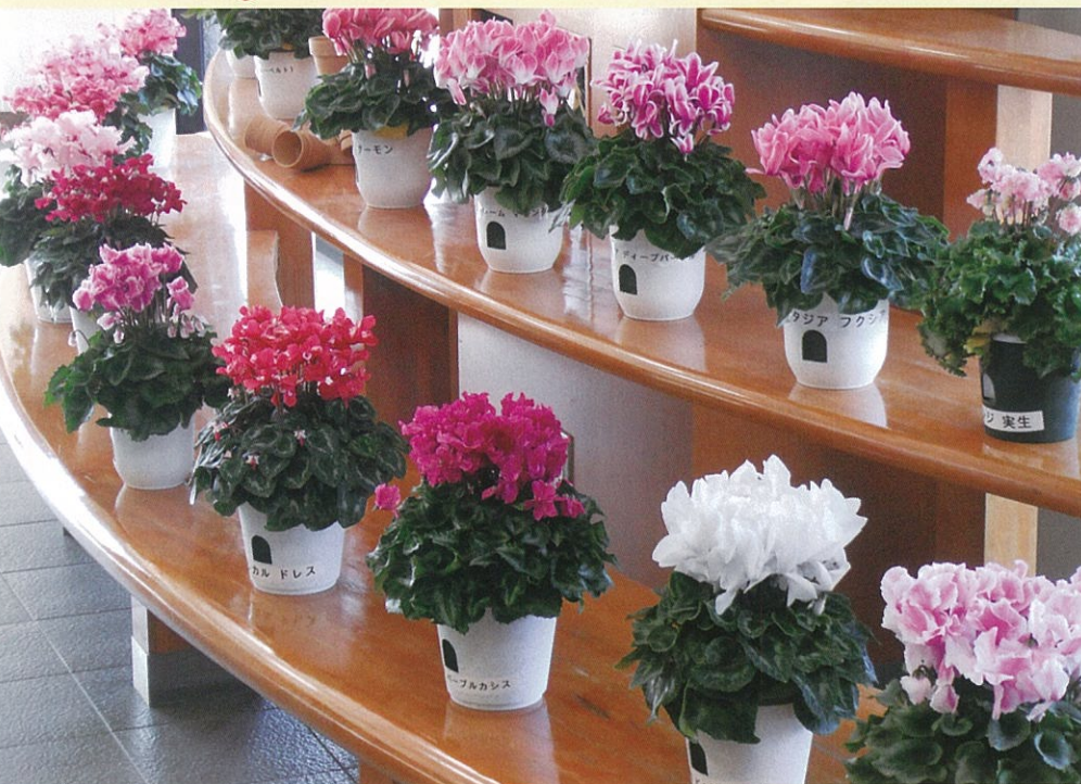
2月下旬頃までセンターのギャラリーにシクラメンの「品種展示」をしています。中には珍しいもの。